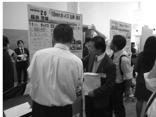
質問に答え、さらに詳しく説明する発表者

また、校種を超えたコミュニケーションも多くなされ、小学校向けの番組を幼稚園や中学校で、また、中学校・高等学校向けの番組を小学校の授業で使ってみたいという声も聞かれました。